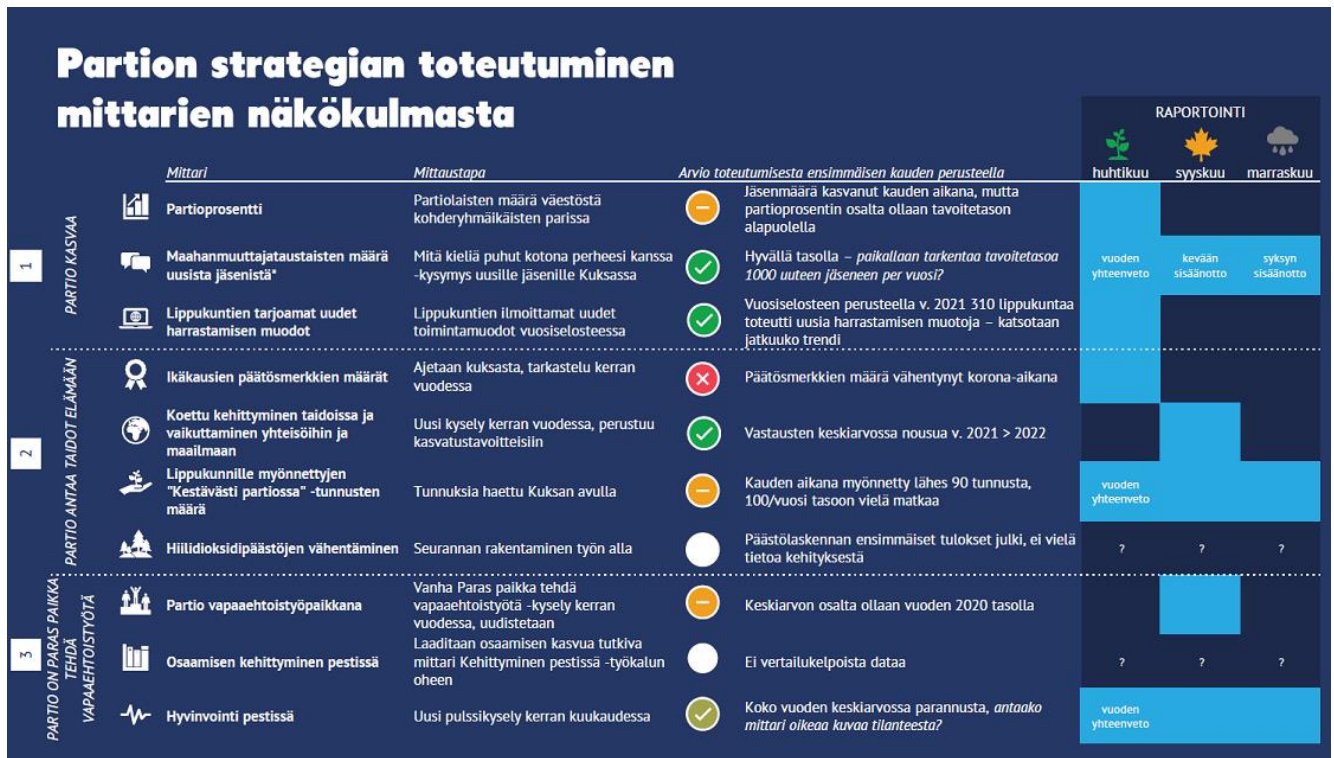
Kuva 2. Strategian mittarit ja niiden toteutuminen vuosina 2021–2023

Partion strategian kolmen päätavoitteen, partio antaa taidot elämään, partio kasvaa ja partio on paras paikka tehdä vapaaehtoistyötä, edistymistä ja tavoitteiden saavuttamista sekä strategian mittareiden saavuttamista on kuvattu lyhyesti seuraavaksi strategiakohtittain.