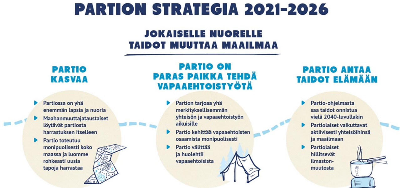
Kuva 1. Partion strategia 2021–2026 ja keskeisimmät strategiset tavoitteet.